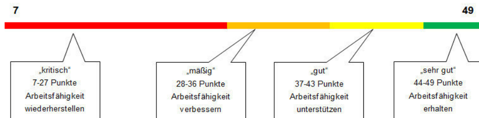
Abb. 2. Einordnung des Work Ability Index-Gesamtwertes